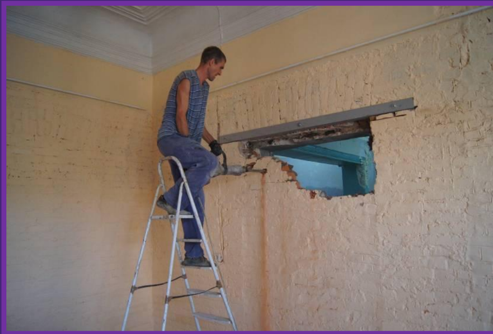
#4. Демонтаж кирпичного проёма, за которым находятся новые залы Музея.