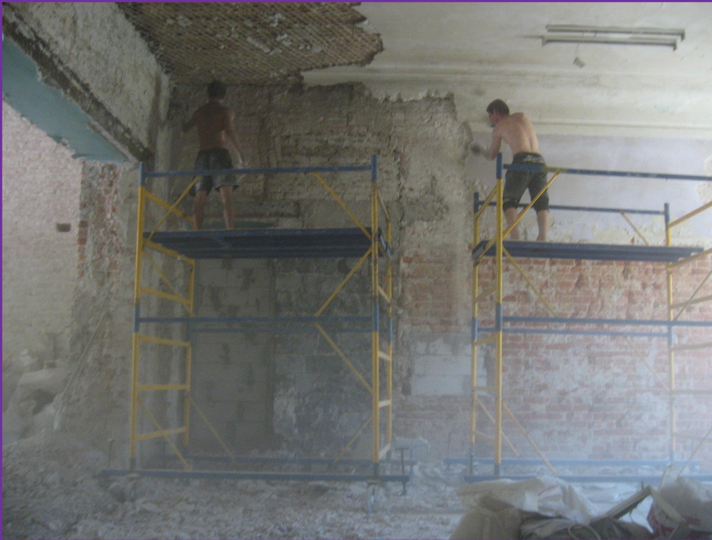
#16. На демонтаж штукатурки стен и потолков ушла целая неделя!