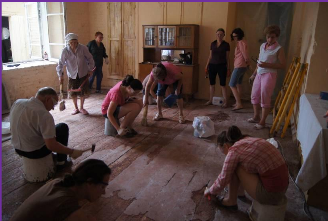
#25. Очистка деревянных полов Экспозиционного зала от старой краски (1этап). В этой части здания нет подвала и конструкции пола стоят практически на земле. Удаление старой краской позволит полам просыхать и продлит их жизнь.