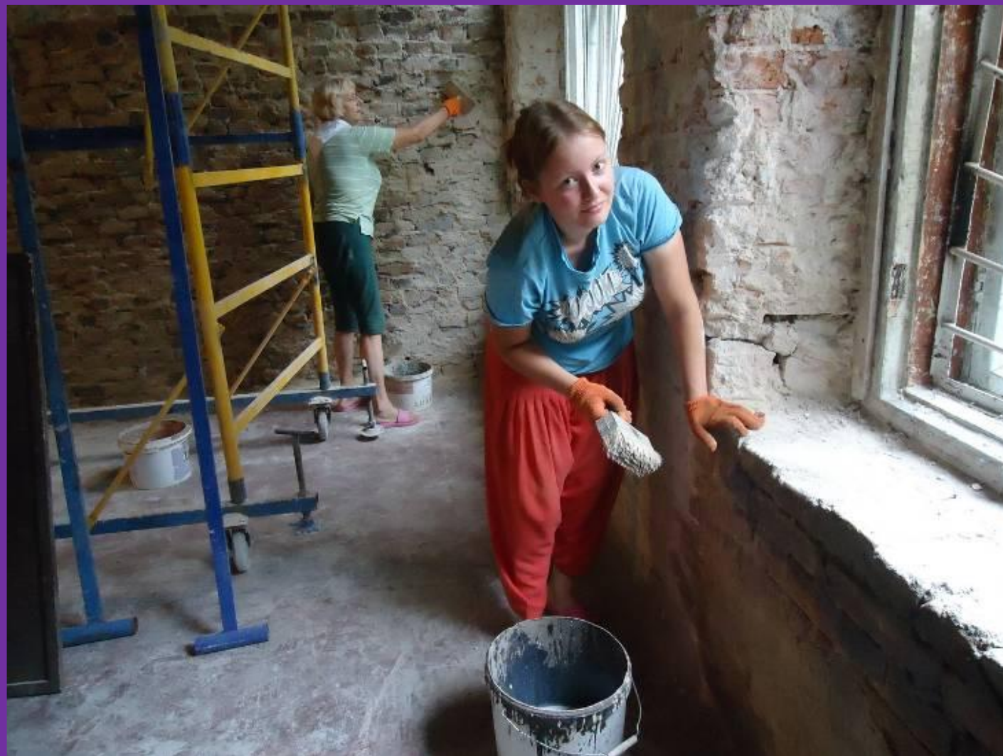
#31. Грунтовка и подготовка стен под окраску. 9 день Волонтерской декады. Силы на исходе, но настроение бодрое!!!