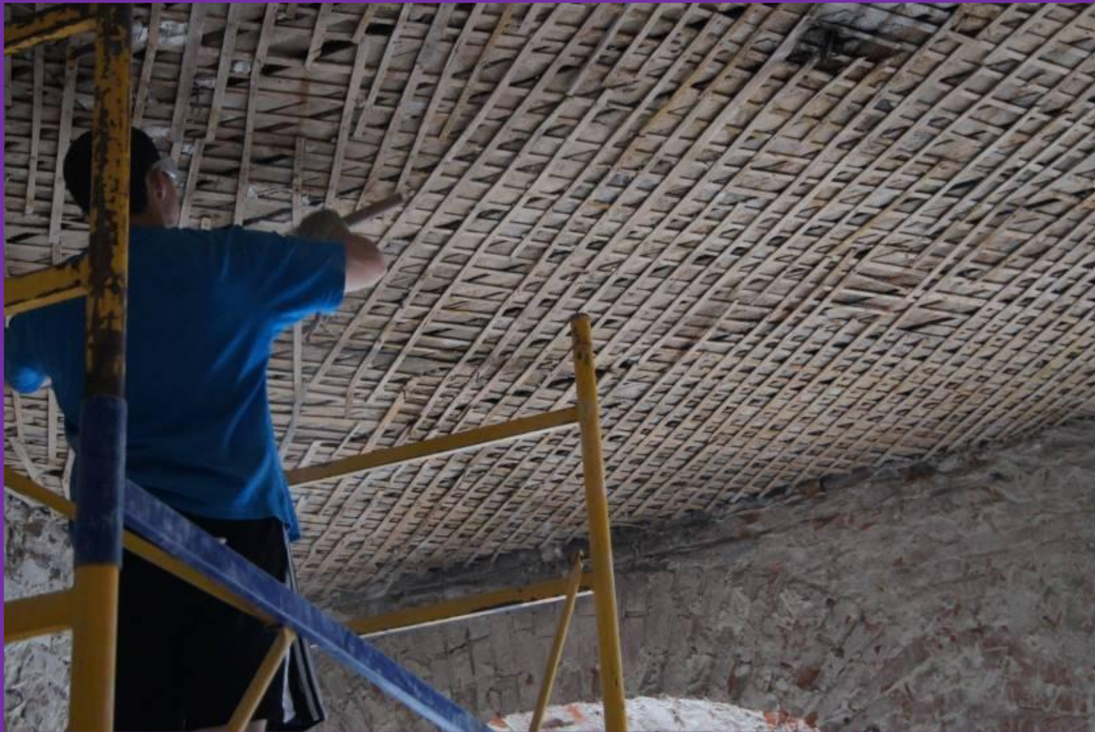
#17. Финишная очистка потолков от штукатурки. Последние штрихи.