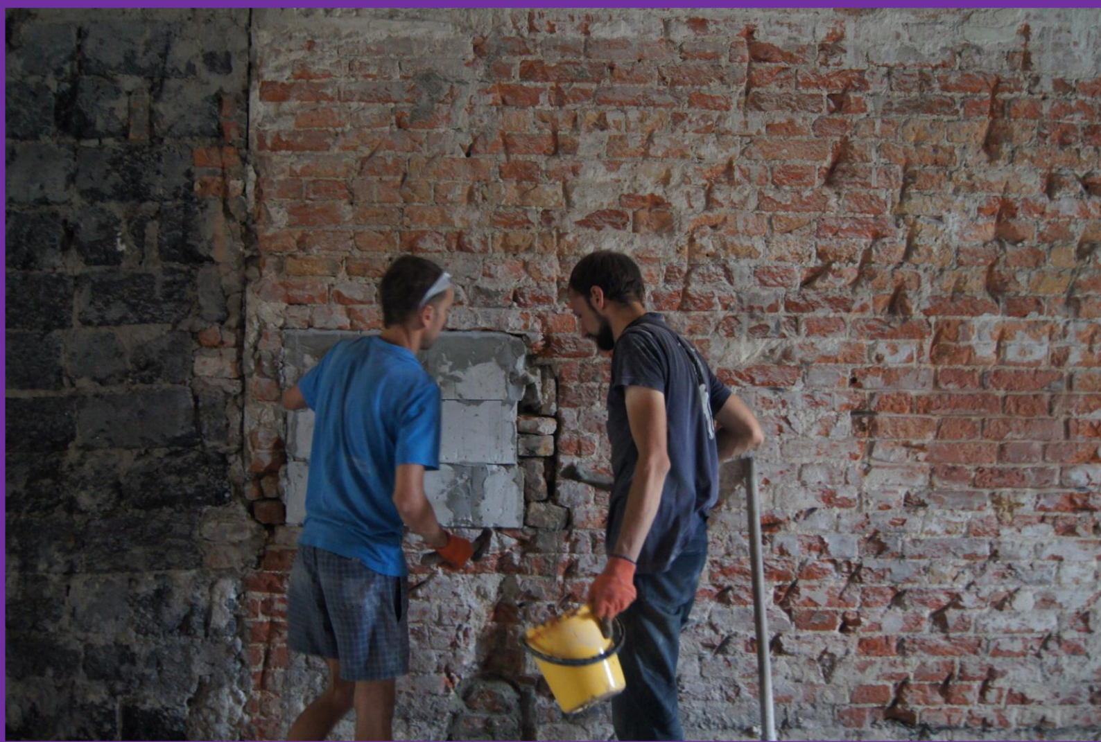
#21. Усиление и ремонт "израненной" временем старинной кирпичной кладки.