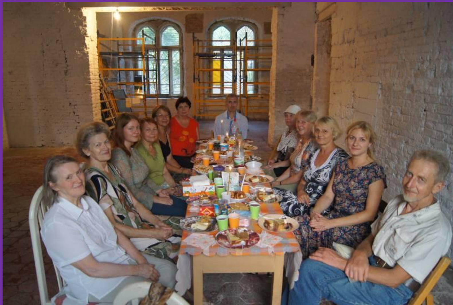
#32. Праздничное собрание по поводу закрытия 2-й Международной Волонтерской декады 2014г в новом зале, названном по цвету стен "Белый".