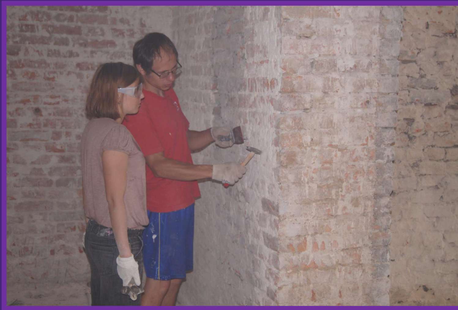
#18. Новое поколение на очистке старинных стен