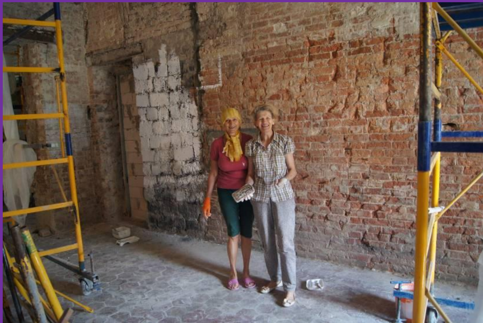
#30. Мы победили грязь и строительный хаос! Начало покрасочных работ. Представители Днепрпетровска и Киева объединяют свои усилия!