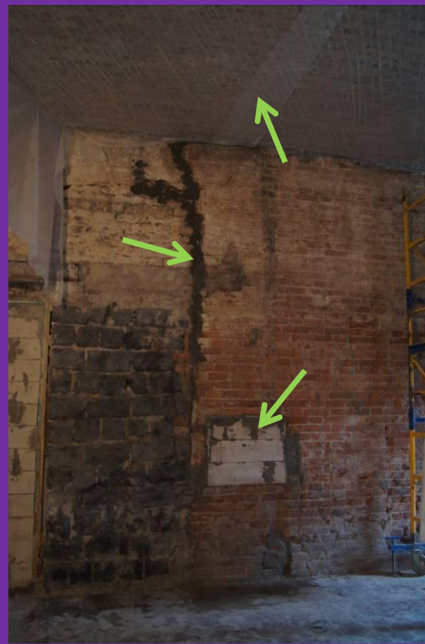
#29. Результаты проведенных работ по закладке ненужных проемов, ремонту кирпичной кладки и натяжке на потолки специального строительного холста.