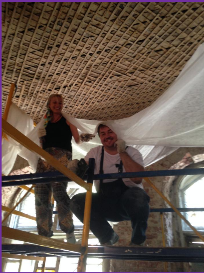
#28. Монтаж строительного холста на потолок защитит от пыли посетителей новых залов.