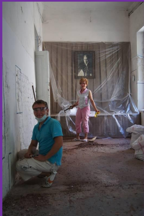
#26. Очистка от многочисленных слоев краски бетонных полов на главном входе в Музейный центр.