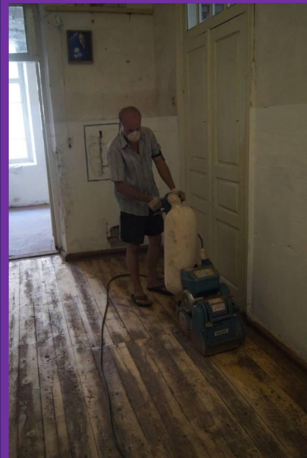
#27. Продолжение работ по очистке полов (этап 2) циклевальной машиной в главном коридоре Музейного центра. На доочистку пола требуется 20-30 проходов шлифмашинки.