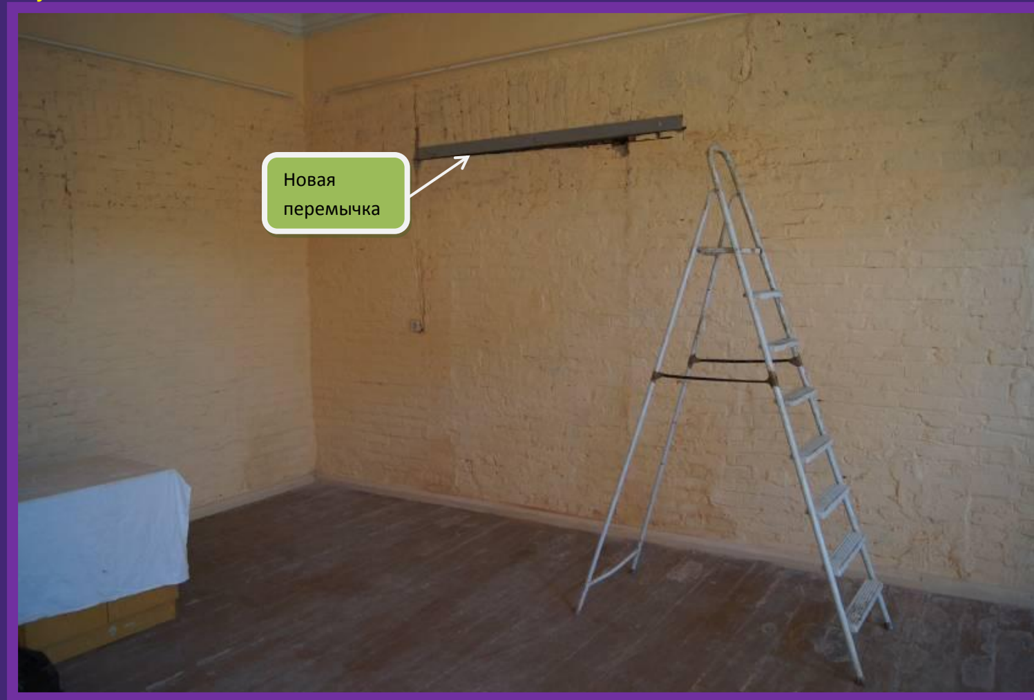
#3. Установка перемычки в пробиваемый проём

12 августа, в День Рождения Елены Петровны Блаватской, во время Дня Вестника Света, залы были торжественно присоединены к объёму Музейного центра и открыты для всех участников научных чтений.