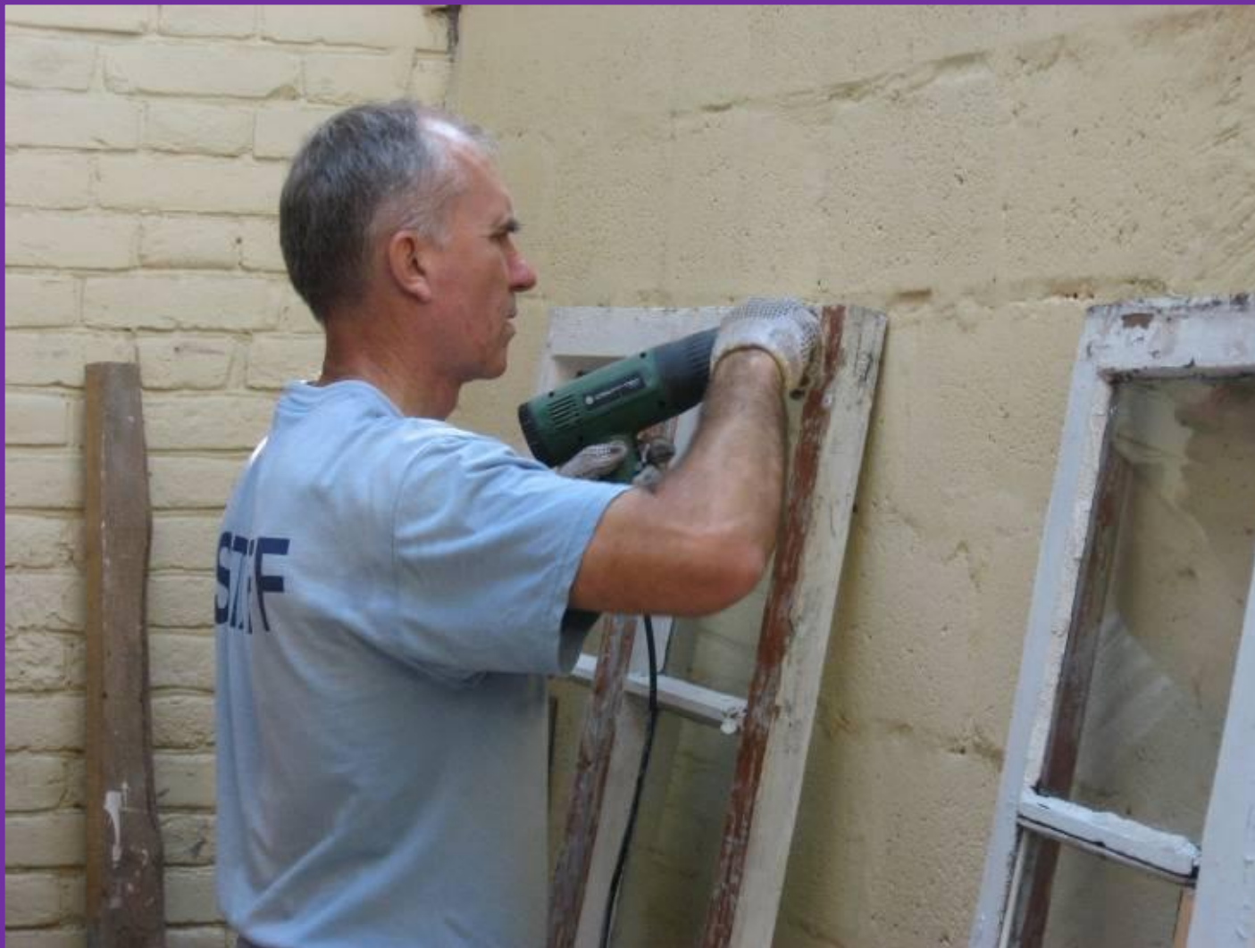
#22. Параллельно с демонтажными работами, велись работы по очистке строительным феном старых деревянных окон .