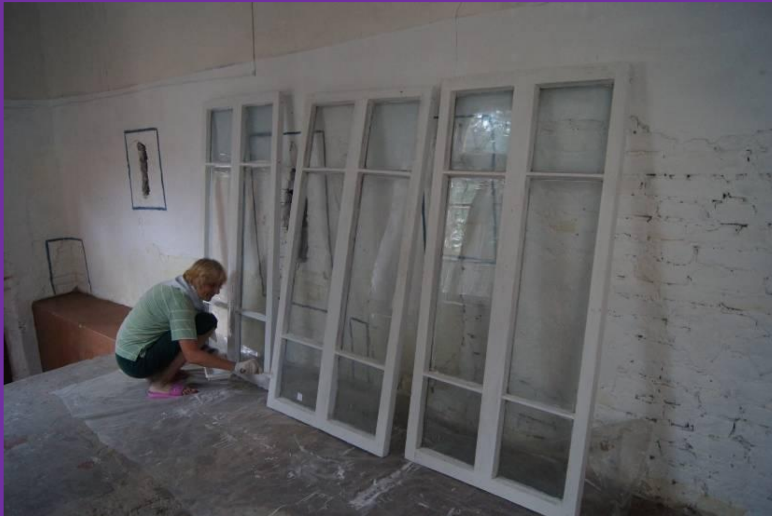
#23. В сенях отреставрированные окна красились