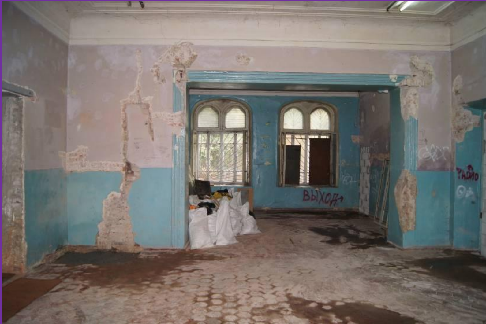
#6. Два новых зала до начала Декады. Вид на окна, выходящие на ул. Ленинградскую