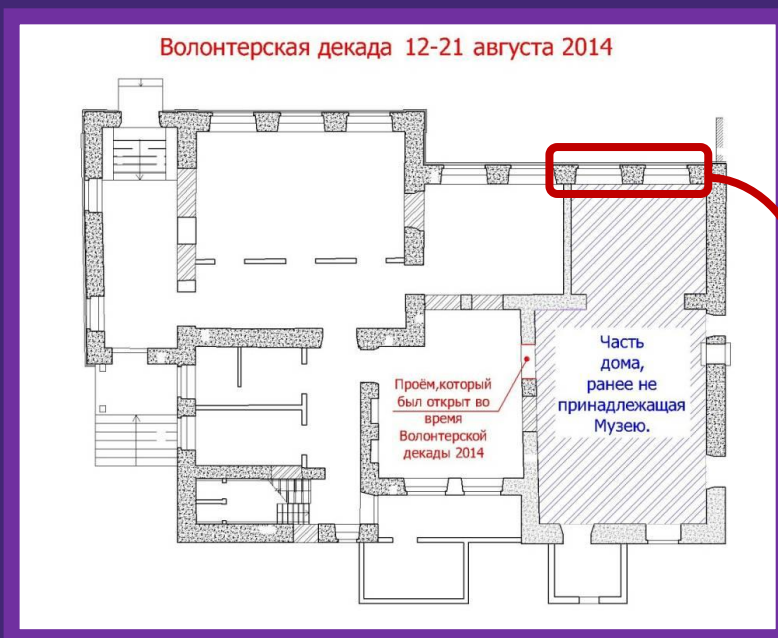
#1. План 1-го этажа

Два просторных светлых зала с высокими потолками, общей площадью 82 кв.м., в ходе Волонтерской декады 2014 года были присоединены к объему Музейного центра, завершив тем самым, долгий и тяжелый период восстановления целостности Дома-музея.