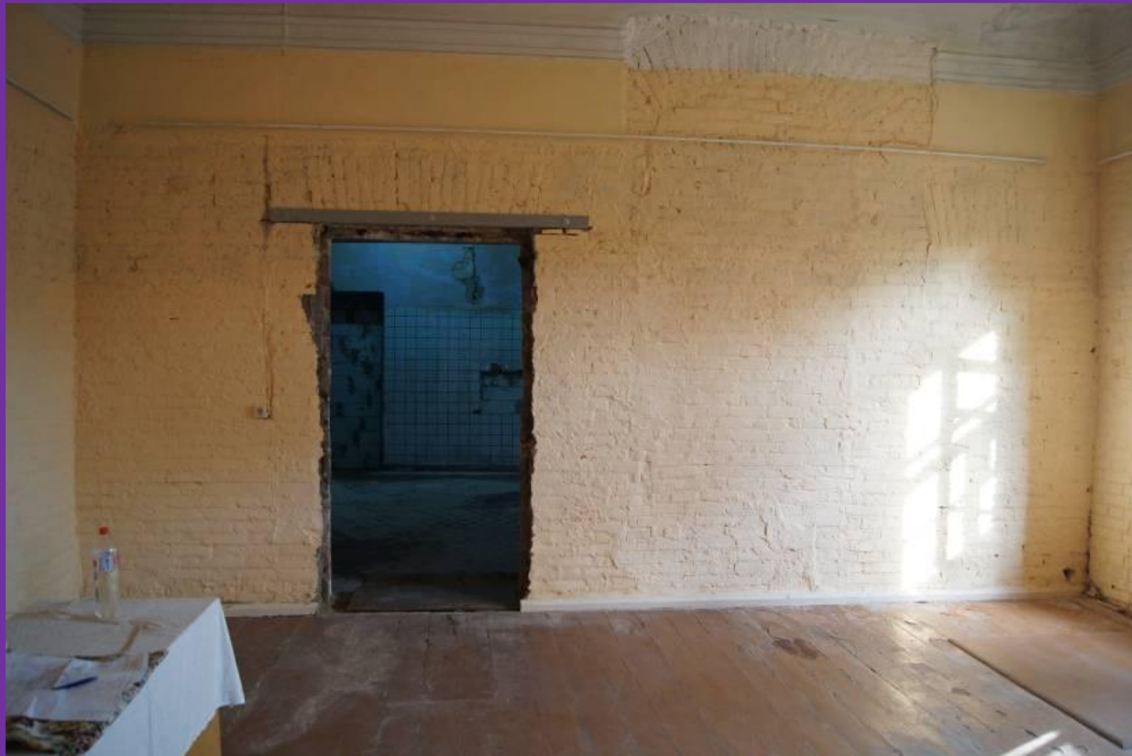
#5. Проём пробит! 10 августа 2014.