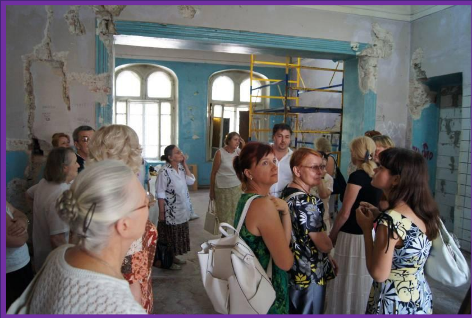
#10. Первые посетители новых залов - участники Дня Вестника Света .12 августа 2014г.