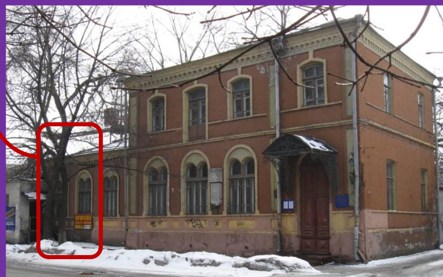
#2. Главный Фасад Музейного центра по ул.Ленинградской,11. Красным цветом выделены окна той части здания, которая ранее не входила в объем Музейного центра и была присоединена к нему во время 2-й Волонтерской декады.