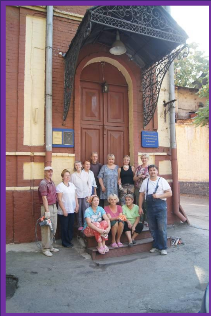
#13. Участники 2-й Международной волонтерской декады на крыльце Музейного центра Е.П.Блаватской и её семьи.